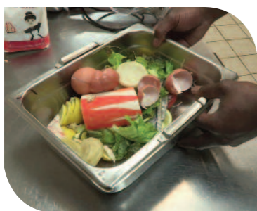
Restauration collective et commerciale